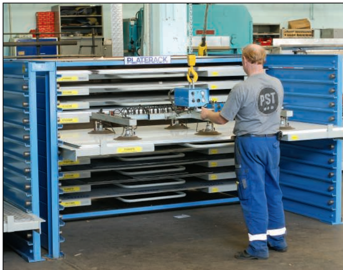
PLATERACK Plåtbyrå, det rationella, ergonomiska och utrymmesbesparande förvaringssystemet.