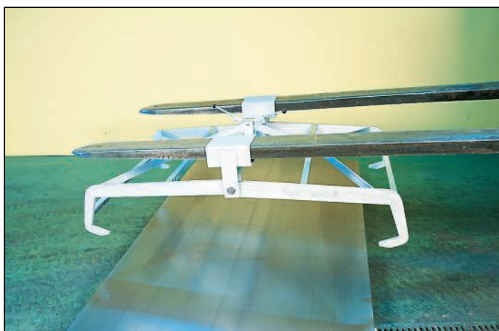
Lyftklämma för enkel laddning av byrå, finns till truck eller travers.