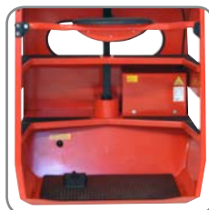
Lågt insteg för föraren. Pedalen fungerar som "död mans grepp".