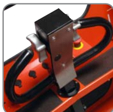
Elektronisk, steglös hastighetsreglering. Central placering av alla betjäningfunktioner.