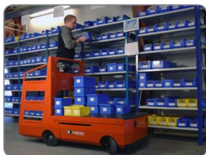
Logirunner för orderplockning. Trappsteg på båda sidor av förarplatsen gör det lätt att nå godset.