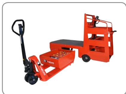
Batterierna är placerade i en utdragsenhet - enkel åtkomst vid batteribyte och underhåll. Perfekt vid flerskiftsdrift.

En kraftig konstruktion säkrar en lång livslängd och ger låga underhållskostnader.