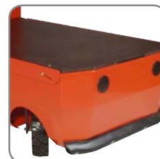
Rörliga delar är avskärmade och därmed skyddade mot stötar och liknande.