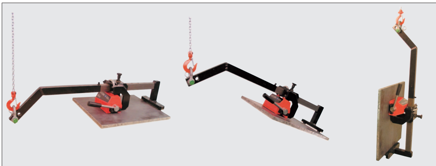
BUX Permanentlyftmagnet typ NEOHV möjliggör att lyfta materialet från horisontellt läge till vertikalt, eller vice versa.