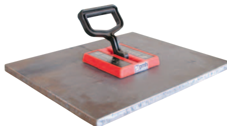
BUX Handmagnet för manuell hantering av plåtar och detaljer.