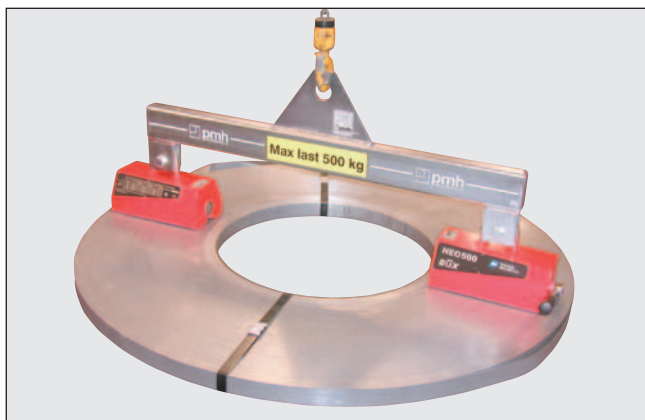
BUX Permanentlyftmagneter typ NEO 500 monterad i ett fast lyftok för hantering av coil.