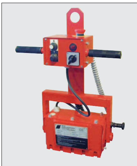
BUX Elektropermanent lyftmagnet typ EPH-1 monterad i ett tiltbart lyftok. Manöverbox med inbyggd telferstyrning.