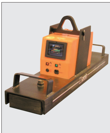
BUX Batterilyftmagnet typ BM 5000.