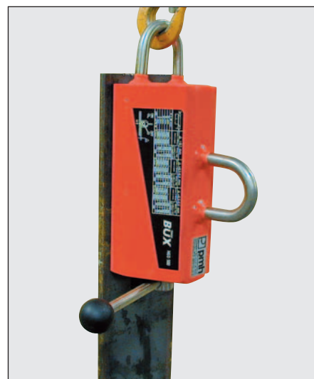
BUX Permanentlyftmagnet typ NEO 500 med extra lyftögla för vertikala lyft.