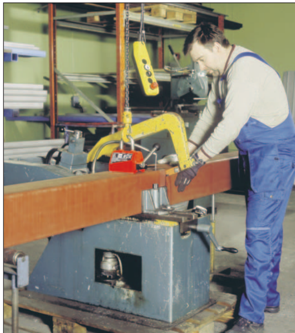
BUX NEO för lyft av plant och runt material.