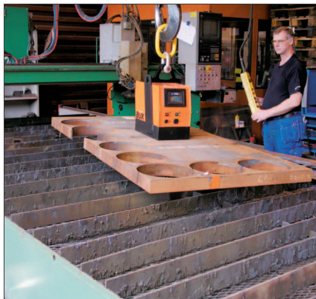
BUX BM Batterilyftmagnet för lyft av plant material.

BUX Batterilyftmagnet finns i två utföranden. BM för lyft av plant material samt BMP för lyft av plant eller runt material.