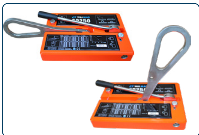
GP-250 Handmagnet med lyftögla

Med WRM-1 kan lättare hantering göras med ett spännband runt vristen och med en kapacitet på 5 kg. MC-2 finns med lyftkapacitet på 70 respektive 90 kg, med manuell excentrisk släppfunktion via handtaget. MC-2S är uppbyggd helt i metall för tuffare miljöer. GP-250 gör det enklare att hantera ännu tyngre plåtar och har en kapacitet på 250 kg vid horisontellt lyft och 80 kg vid vertikalt. Magneten är avsedd för lyft i lastkrok.