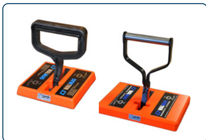
MC-2 och MC-2S Handmagneter