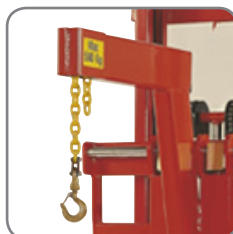
Lyftkättingens längd kan enkelt justeras utan hjälp av verktyg.