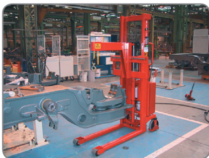
Kranarmen hos en underleverantör till tågindustrin.