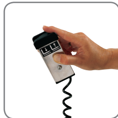
Lyft- och sänkfunktionen på de elektriska Logiflex modellerna kan betjänas med ett fjärrmanöverdon (extrautrustning).