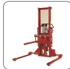
Övrig extrautrustning: Bl.a. pikbom, plattform, rull- och fatvändare