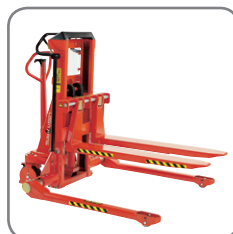
Avsedd för Logiflex med variabel gaffelkonsoll.