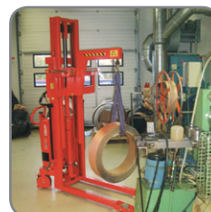
Rullar av bandstäl lyfts in i en stansmaskin.

Vi erbjuder också kundanpassade lösningar. Fråga efter mer information eller besök www.pmh.se { @ ^