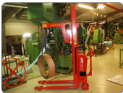
Kranarmen är konstruerad för att hantera verktyg och maskindelar.

En kraftig konstruktion säkrar en lång livslängd och låga underhållskostnader.