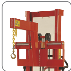
Quick-shift gör det enkelt att byta ut kranarmen mot någon annan extrautrustning eller gafflar.