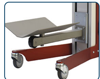
Lastbord EPDV för rullar