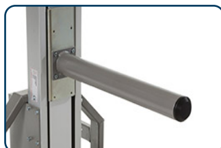
Pikbom, enkel eller dubbel