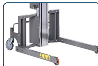
Flexi ben, fasta framhjul