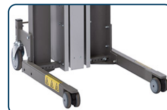
Flexi ben, svivlande framhjul