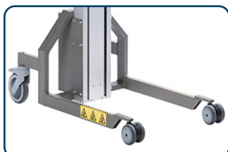
Box ben, svivlande framhjul

Flexi ben - svivlande Ø125 mm bakre hjul med broms och dubbla svivlande Ø75/50 mm eller fasta Ø80 mm framhjul