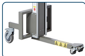
Center ben, svivlande framhjul