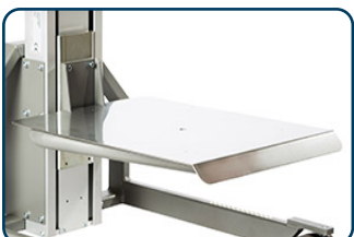
Aluminium / rostfritt lastbord

Stort antal standardverktyg som tex lastbord, gafflar, spjut, pikbom, klämverktyg och expandrar finns till lyftvagn Impact 80. Expandrar som lyfter rullen i centrum hylsan och man kan manuellt vrida den 90°, från stående till liggande eller tvärtom. Nedan syns ett urval av de verktyg som Impact 80 kan utrustas med.