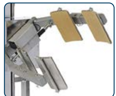
Drivet klämverktyg för vridning av fat/rollar