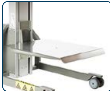
Lastbord i rostfritt eller aluminium