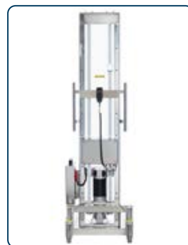
INOX E300 baksida