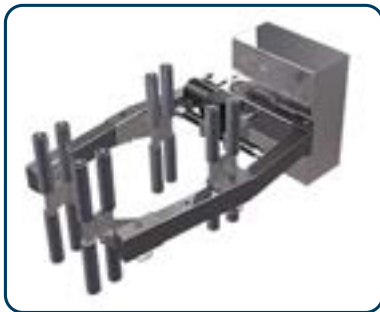
Drivet klämverktyg för vridning av fat/rollar

Nedan visas bilder på några av de verktyg som finns till Hovmands lyftvagnar