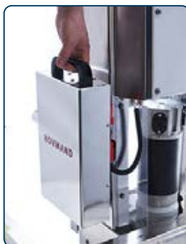
INOX E300 utbytbart batteri