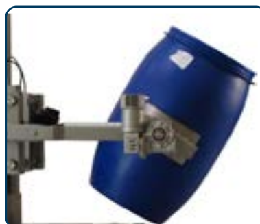
Drivet klämverktyg för tilt av fat/rollar