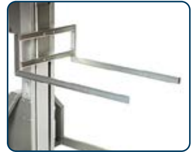
Gafflar fasta eller justerbara, finns även i rostfritt