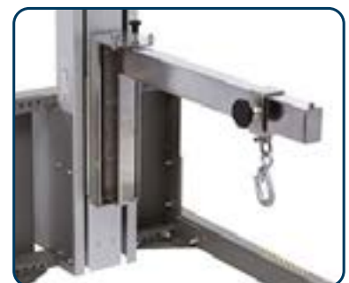
Kranarmar i rostfritt