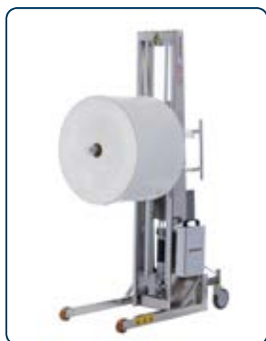
INOX E300 med enkel pikbom

E300 lyftvagnen har många möjliga användningsområden tack vare sitt utbud av manuella och elektriska verktyg inklusive hantering av rullar, trummor, tråg och lådor. Kapslingsklass IP66 för enkel rengöring även med rengöringsmedel.