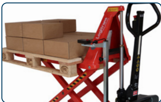
Automatisk nivåreglering (extrautrustning) ger konstatnt arbetshöjd.

Elektriskt höglyftare EHL, är försedd med nödstopp och momentanstopp som standard och en energisnål motor för fler lyft per laddning. Höglyftaren har modern industridesign med ett ergonomiskt utformat handtag och är försedd med boggiehjul för smidig och tyst drift. Saxlyftvagnens kapacitet är 1500 kg som kan transporteras och lyftas upp till 400 mm och från 400 upp till 800 mm kan 1000 kg lyftas. Alla funktioner är centralt placerade på handtaget och nås enkelt.