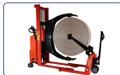
Rullyftaren är en unik partner till