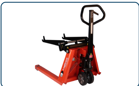
Kompakt, mycket manövrerbar