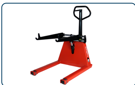
Rullyftarens snäva och korta ben

Axeln som fixerar rullen i produktionsmaskinen används även vid transporten på Rullyftaren. Rullen kan alltså lätt positioneras på rätt ställe i maskinen. Med det flexibla låssystemet kan Rullyftarens gafflar lätt ställas in på olika rullstorlekar. En speciell flödesventil reglerar sänkingsfunktionen och säkerställer en varsam positionering av rullen.