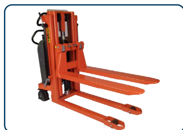
LOGITRANS ELF staplare

Med en och samma staplare kan gods transporteras, lyftas och hanteras på många olika sätt. Konstruktionen fokuserar på användarens säkerhet och ergonomiska arbetsförhållanden. God manövrerbarhet tack vare kort bygglängd, stor styrvinkel, tvångsstyrda hjul och låg egenvikt. Staplarna ELF är som standard avsedda för pallhantering, men finns även i bredspårigt utförande för lyft av slutna pallar. Bredspåriga staplare ELFS har som standard inställbara gafflar så att pallar med olika bredd kan lyftas.