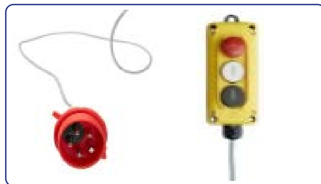
CEE-plug och manöverdon